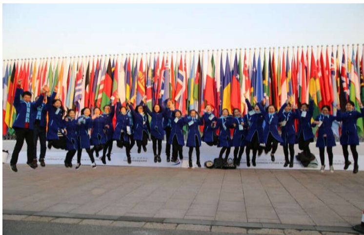
“越秀”志愿者参与G20杭州峰会、世界互联网大会等服务