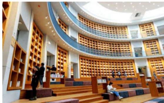
浙江省首个“席地而坐看书学习”的图书馆