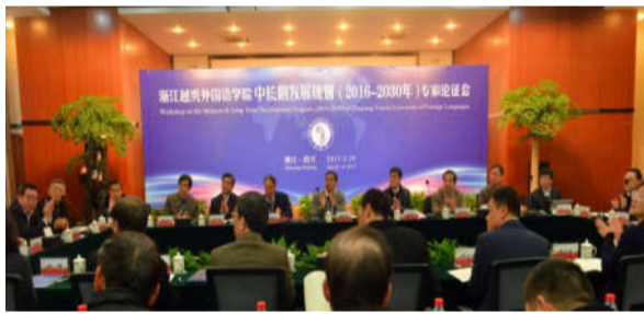
“越秀”聘请国内著名高校专家参与论证“中长期发展规划”