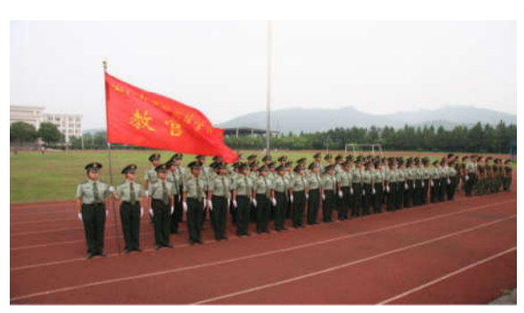
“越秀”成为浙江省大学生教官培训中心