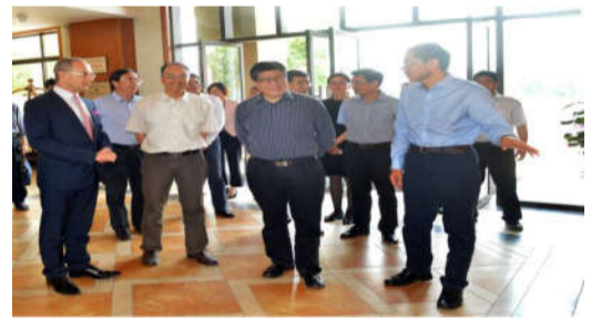
2017年5月26日，浙江省副省长成岳冲到“越秀”调研