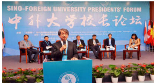
2016年10月，“越秀”成功举办了中外大学校长论坛

根据《中国大学及学科专业评价报告(2017-2018)》，越秀的酒店管理专业在全国开设该本科专业的162所高校中排名第5位，商务英语专业在全国开设该本科专业的235所高校中排名第20位，传播学专业在全国开设该本科专业的57所高校中排名第13位，编辑出版学专业在全国开设该本科专业的56所高校中排名第16位。