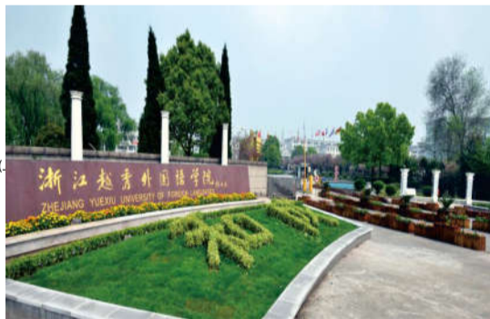
浙江越秀外国语学院