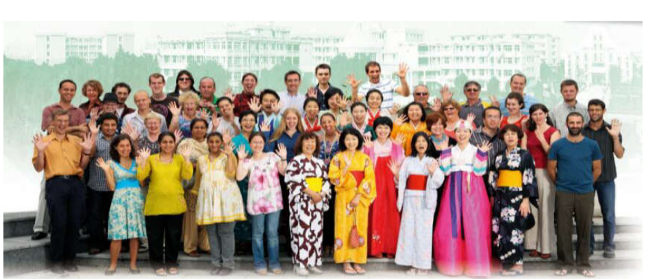
“越秀”每年聘请来自美国、英国等30个国家的100多位外教